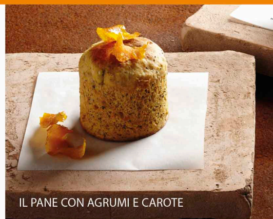
IL PANE CON AGRUMI E CAROTE