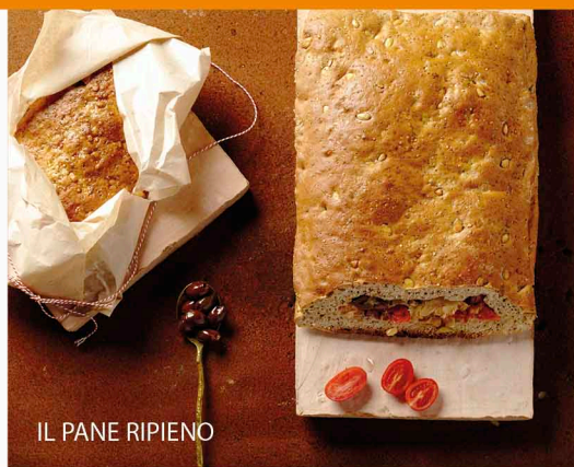
IL PANE RIPIENO